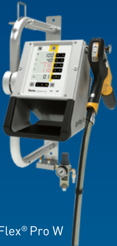
OptiFlex® Pro W