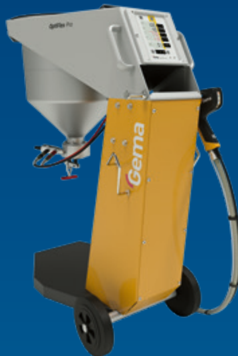
OptiFlex® Pro S