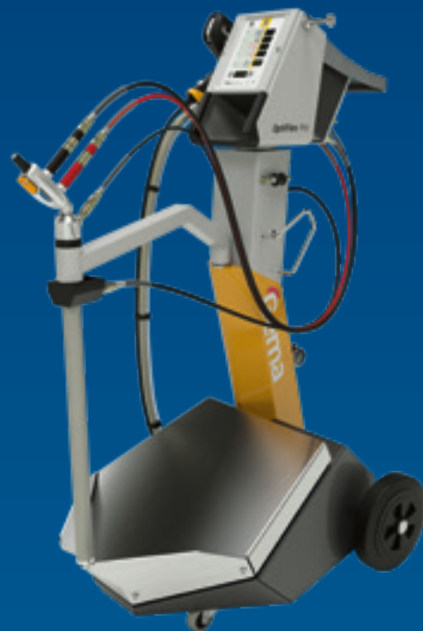
OptiFlex® Pro Q