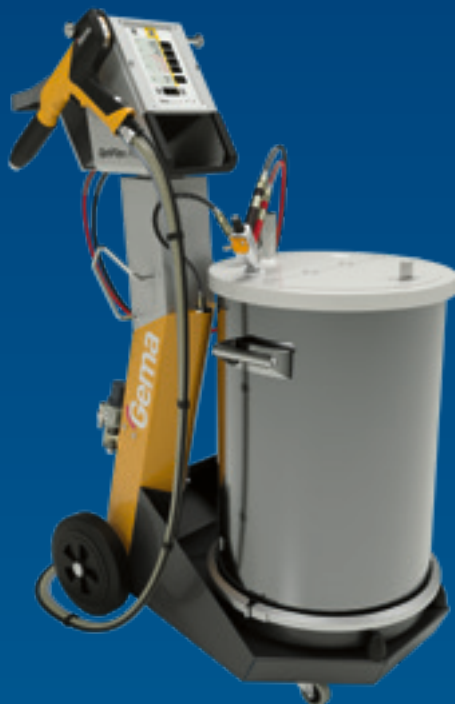
OptiFlex® Pro F