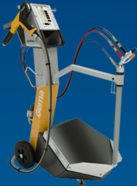
OptiFlex® Pro B