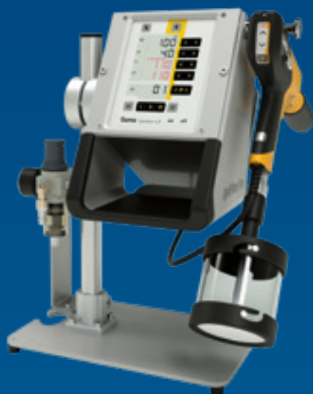
OptiFlex® Pro C