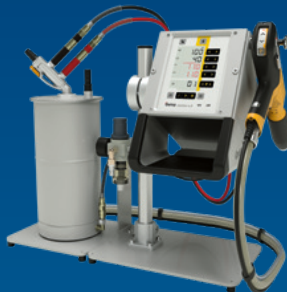
OptiFlex® Pro L